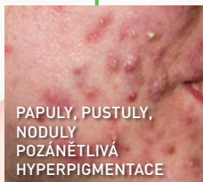
PAPULY, PUSTULY, NODULY POZÁNĚTLIVÁ HYPERPIGMENTACE